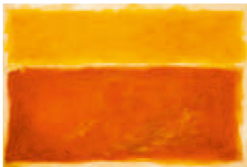
Lothar Kenk Malerbetrieb

In jeder Hinsicht das Besondere Wandgestaltung • Bodenbeläge • Fassaden Lothar Kenk Malerbetrieb GmbH