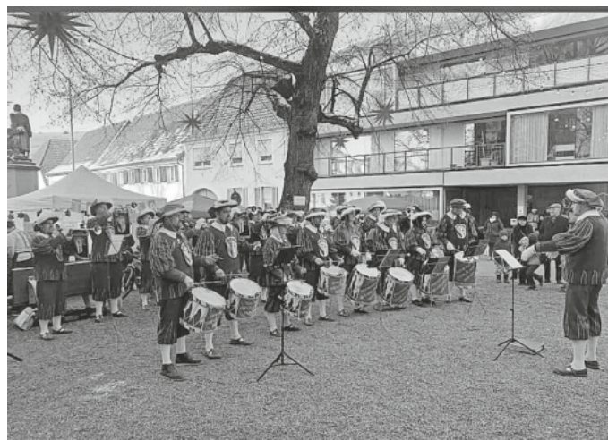
Eröffnung Weihnachtsmarkt Ihringen

Die diesjährige Saison endet für den Fanfarenzug am Samstag 09.12 mit der musikalischen Begleitung des Weihnachtsmarkts in Weisweil am Rhein, der von dem befreundeten Fanfarenzug „Ritter Hermann Weisweil“ veranstaltet wird.