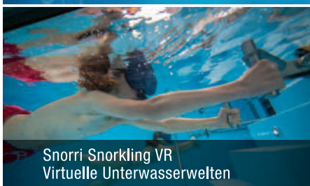
Snorri Snorkling VR Virtuelle Unterwasserwelten