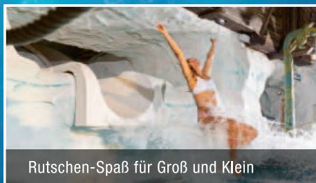
Rutschen-Spaß für Groß und Klein