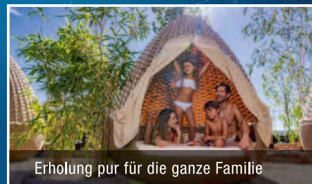
Erholung pur für die ganze Familie