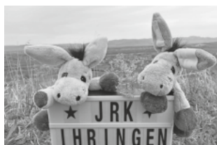
JRK Ihringen Esel Maskottchen

Gerne können wir dann auch eine Schnupperstunde vereinbaren und Du lernst uns einfach kennen.