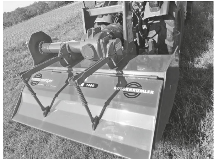
Sauerburger Panda 1400 S