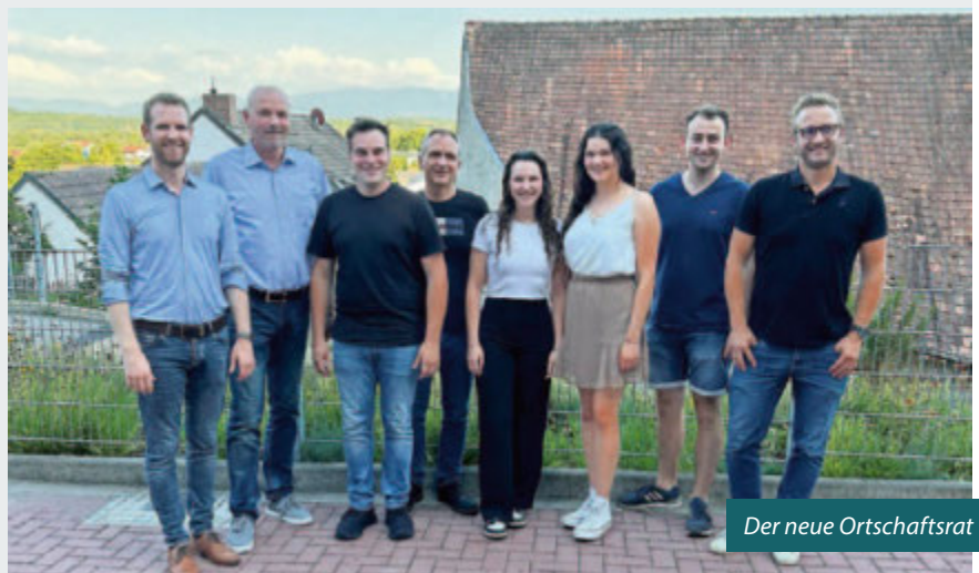
Der neue Ortschaftsrat